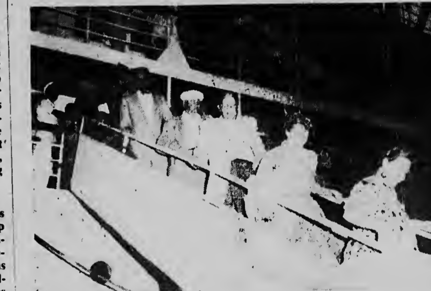
De touristen gaan aan wal.

Hij denkt er echter wel zeer sterk over, angezelen hij a prima vista zag, dat zijn passagiers het bezoek op prijs stelden.